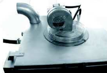
Ventilatore con resistenza Fun with resistance