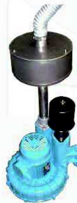
Soffiante con resistenza Blower with resistance